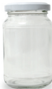
Til hele glas