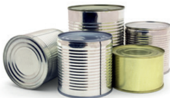
Fra gamle dåser