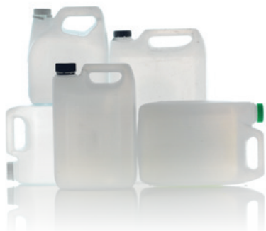
Fra tomme dunke