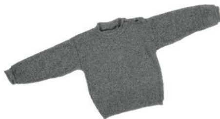
Til fuldige trøjer