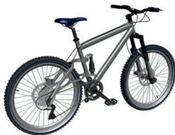
Til ny cykel